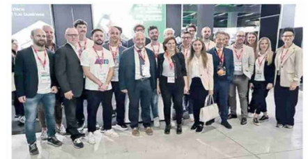
La delegazione marchigiana con i rappresentanti delle 20 imprese