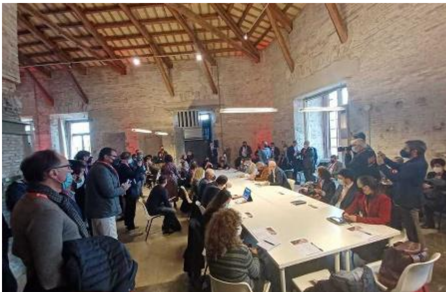
La tappa ad Ancona del Roadshow di Smau

Al centro del dibattito i temi dell'Open Innovation, con un focus particolare sui temi Trasformazione Digitale e Transizione Energetica attraverso incontri dal vivo e tavoli di lavoro. Sono stati presentati progetti, iniziative ed esperienze di innovazione e anche nuove realtà tra le startup nell'ambito di uno speed pitching. E, come ha reso noto la Camera di Commercio, nelle Marche sono circa 400 le start up innovative, poco più del 4% del totale delle nuove società di capitali. I settori in cui operano maggiormente sono quello informatico e legato alla produzione di software (31,5%), seguito da ricerca scientifica e sviluppo (14,7%). E tra le figure più ricercate dalle imprese ci sono i tecnici informatici, ingegneristici e della produzione (56,1%), operai specializzati e conduttori di impianti delle industrie tessili,